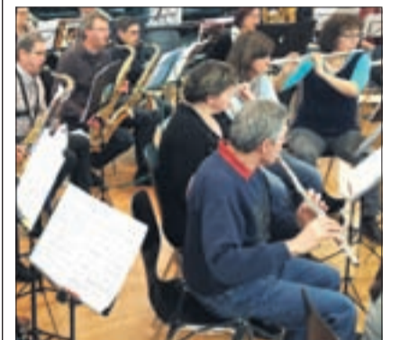
Die Bläser- und Perkussionsklassen 18+ laden am 4. Februar zum Konzert in die Pfarrkirche Bürglen.