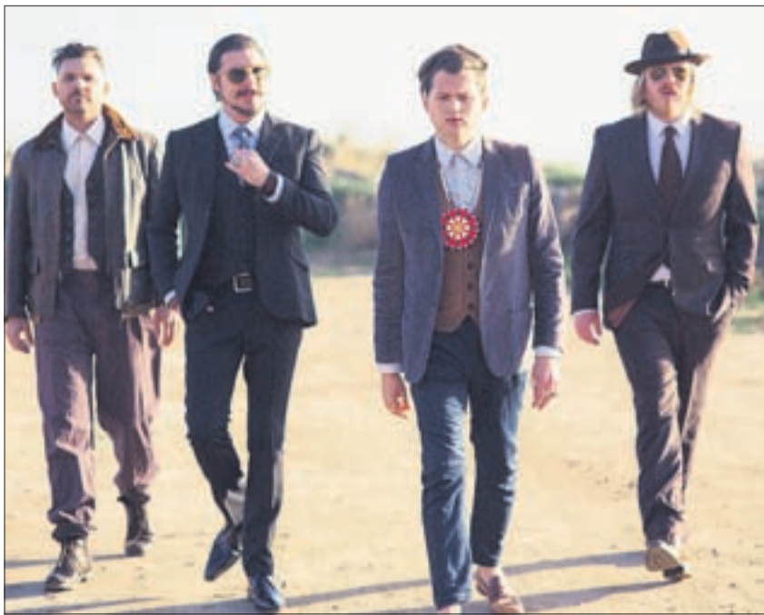
Die amerikanische Rockband Rival Sons gibt sich in Andermatt die Ehre und wird am neuen Festival ein Konzert geben.