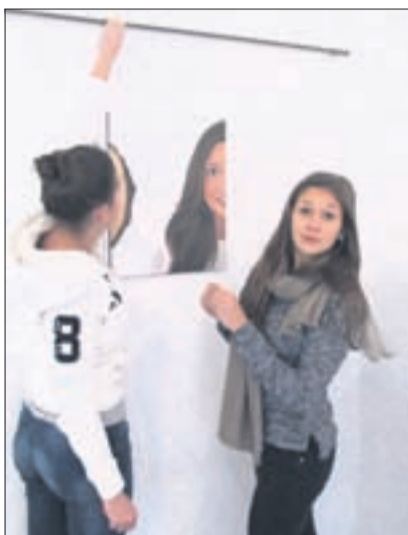
Schülerinnen beim Einrichten der Ausstellung.

Grenzen und Übergänge sind allgegenwärtig. In der bildenden Kunst haben sie eine wichtige Bedeutung als formales, gestalterisches Mittel. So grenzt die Kontur die Figur vom Hintergrund ab. In der linearen Zeichnung übernimmt diese Funktion die Linie, in der Malerei und dem fotografischen Bild sind es die